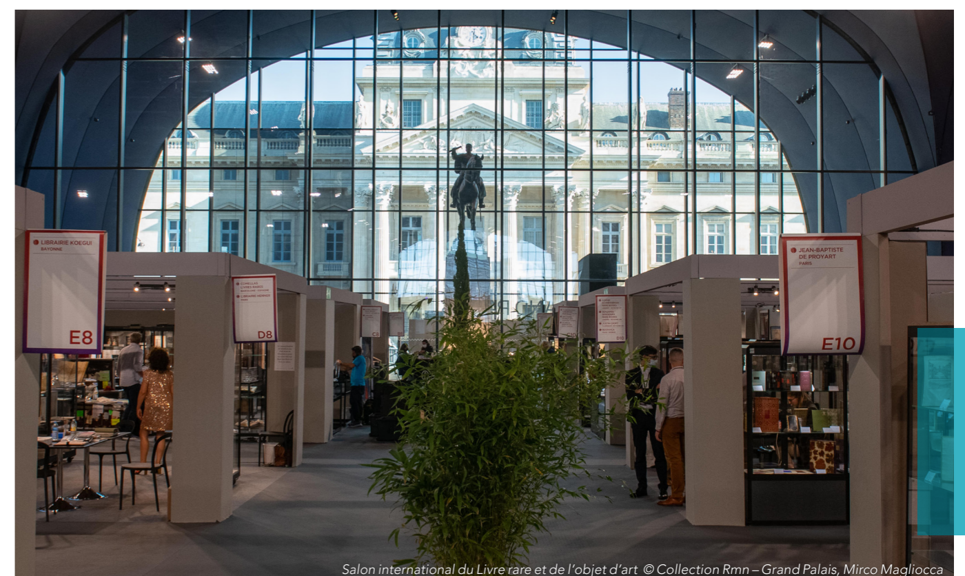
Salon international du Livre rare et de l'objet d'art

* Dekret z dnia 31 sierpnia 2006 r. w sprawie zwalczania hałasu w sąsiedztwie nakłada wymóg nieprzekraczania poziomu hałasu resztkowego o więcej niż 5 dB(A) w dzień lub 3 dB(A) w nocy.