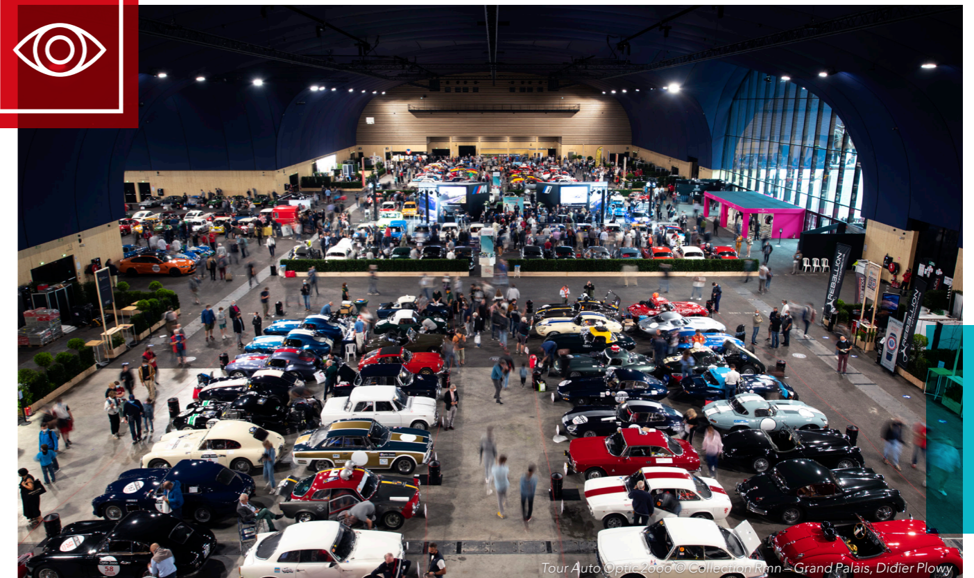
Tour Auto Optic 2000