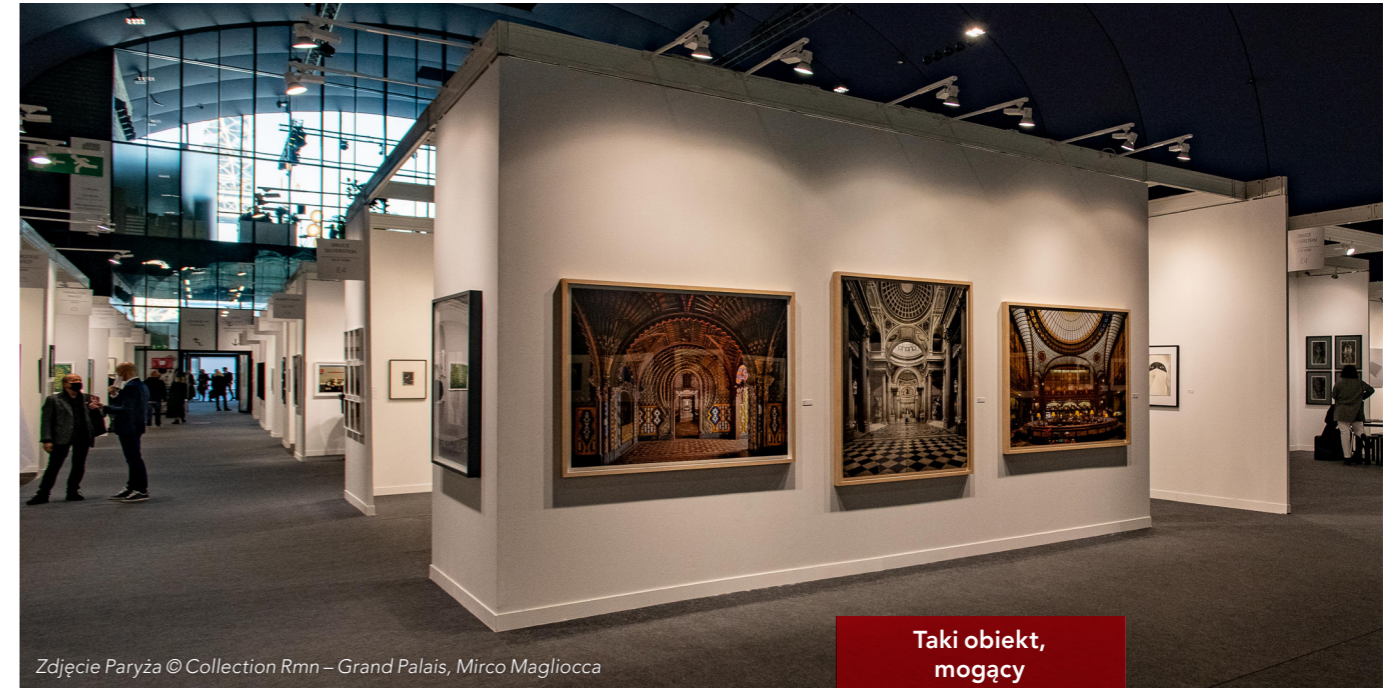
Zdjęcie Paryża