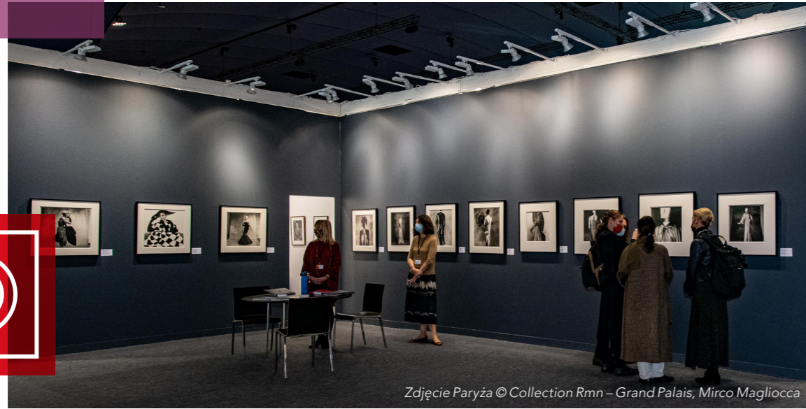
Zdjęcie Paryża