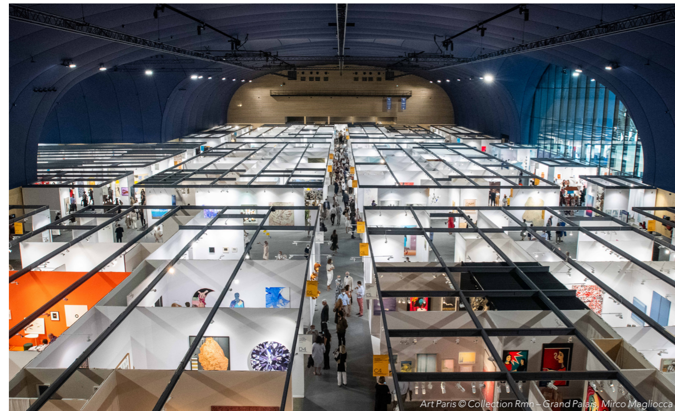
Art Paris

Bez względu na publiczność, podwójna powłoka stanowiąca osłonę zapewnia bardzo skuteczną izolację akustyczną i termiczną oraz spełnia wymagania wentylacyjne. Jak podkreśla Juliette Armand, dyrektor ds. wydarzeń i operacji w obiekcie: „akustyka jest bardzo ceniona przez wszystkich użytkowników ze względu na bardzo mały pogłos”. Rzeczywiście, cichy krajobraz akustyczny lokalu uderza natychmiast po wejściu.