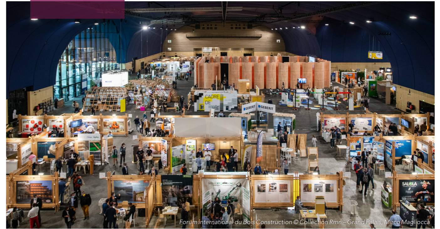
Forum international du Bois Construction

„Akustyka jest bardzo ceniona przez wszystkich użytkowników ze względu na bardzo mały pogłos”