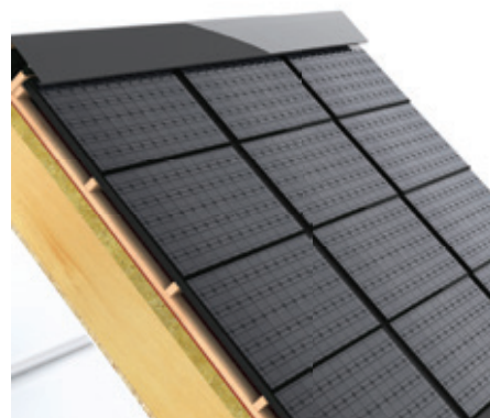
Uitermate geschikt voor zonnepanelen als volledige dakdichting.