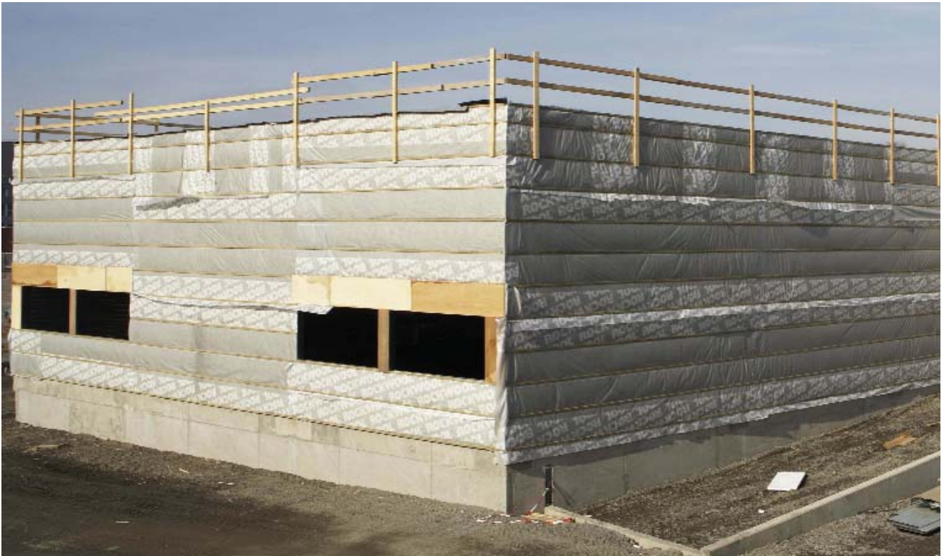
Rockwool Vindsperre benyttet på industribygg

Rockwool Vindsperre rulles på bindingsverket i full etasjehøyde. Dette sikrer rask utførelse uten skjøter.