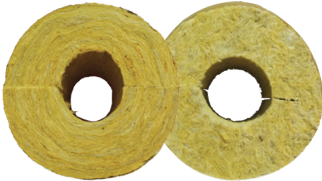
ROCKWOOL 800 torukoorikute kiudude laminaarne struktuur