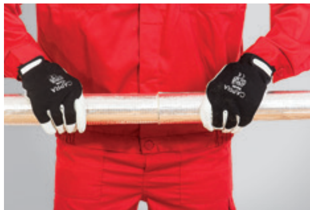
6. Kahe kõrvuti asetseva torukooriku otsad vajutatakse tihe- dalt kokku.