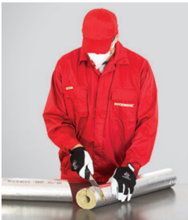
1. Torupõlve isolatsioonidetaili lõikamine, 1. samm.

Torukooriku ettevalmistatud detailid paigaldatakse järjest torule. Vastavalt torukoorikute paigaldamise reeglitele kohandatakse need toru läbimõõduga ja vajutatakse tihedalt kinni. Kõik pikiühendused kleebitakse kinni kleepribaga. Isolatsiooni üksikud osad vajutatakse tiheduse ja isolatsiooni ühtluse tagamiseks tugevalt üksteise vastu. Kõik osade ristiühendused ja liitekohad kaetakse alumiinumteibiga.