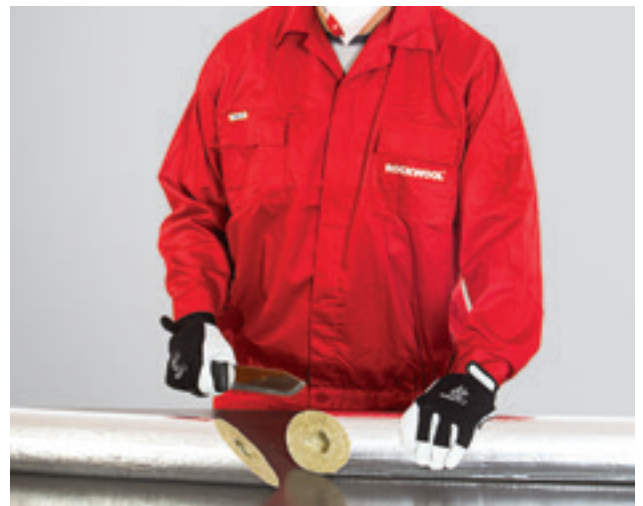
2. 45° nurga all kaheks osaks lõigatud torukoorik.