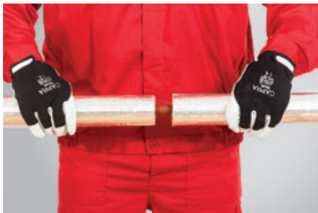
5. Kahe kõrvuti asetseva torukooriku ühendamine.