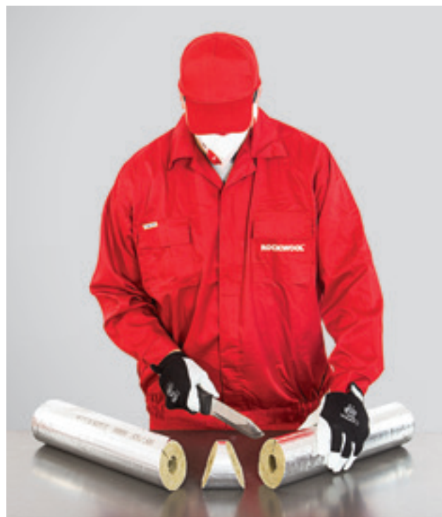
2. Torupõlve isolatsioonidetaili lõikamine, 2. samm.