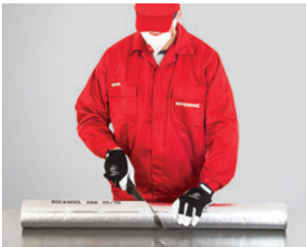
1. Torukooriku lõikamine vajaliku nurga alla.

Torukooriku pikiühendus kaetakse alumiiniumfooliumist kleepribaga ning kleebitakse täpselt kinni. Teist kooriku parajaks lõigatud osa pööratakse 180° ning pannakse torule samuti nagu pandi esimene osa. Torukooriku osad vajutatakse kokku nii, et need 90° nurga alla liituksid. Osade täpne ühendamine tagab isolatsiooni tiheduse. Liitekoht kleebitakse alumiiniumteibiga hoolikalt kinni.