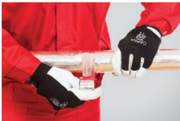
7. Torukoorikute ühenduskoht kaetakse alumiiniumteibiga.