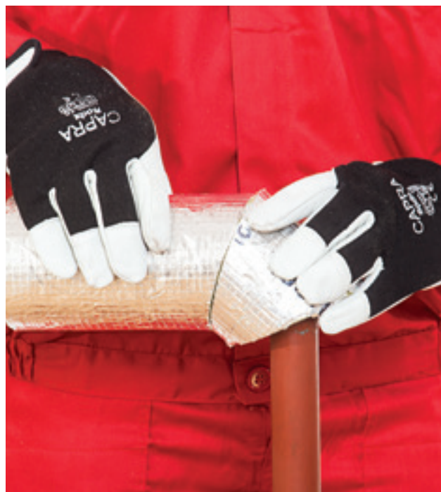
4. Torupõlve detaili täpne ühendamine torukooriku sirge osaga.