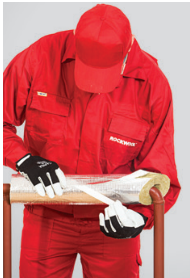
4. Torukooriku pikiühenduse kokku kleepimine kleepribaga.