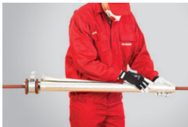
4. Kleepriba täpne kleepimine.