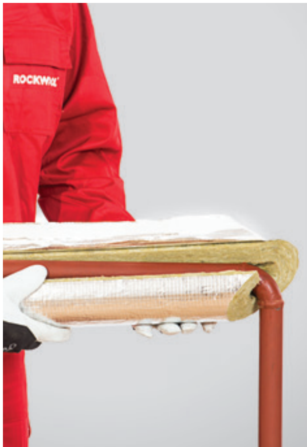
3. Isolatsiooni esimese osa paigaldamine torule.