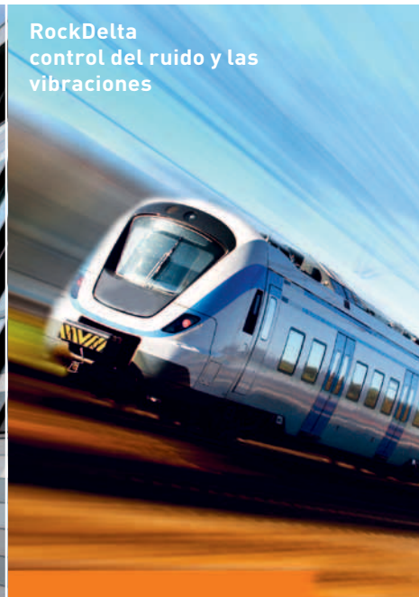
RockDelta control del ruido y las vibraciones