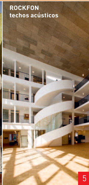
ROCKFON techos acústicos