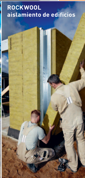
ROCKWOOL aislamiento de edificios