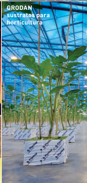
GRODAN sustratos para horticultura