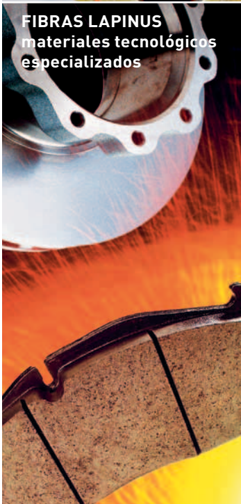
FIBRAS LAPINUS materiales tecnológicos especializados