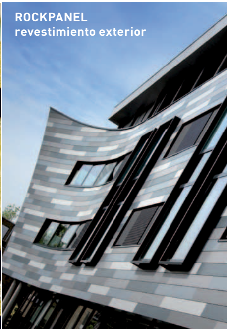
ROCKPANEL revestimiento exterior