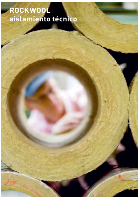
ROCKWOOL aislamiento técnico