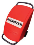
> Rockster 2S (220kg/h)