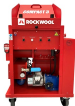
> Rockmaster (600kg/h)