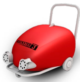
> Rockster 3 (358kg/h)