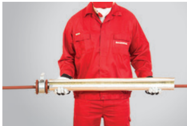
2. Izoliacija pritaikoma prie vamzdžio skersmens