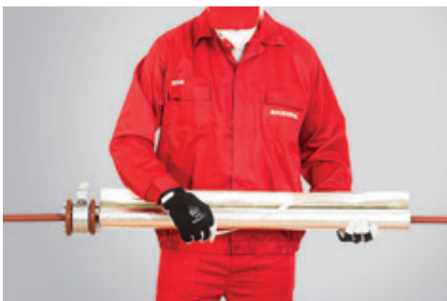
3. Apsauginės juostelės nuėmimas nuo lipnios užlaidos