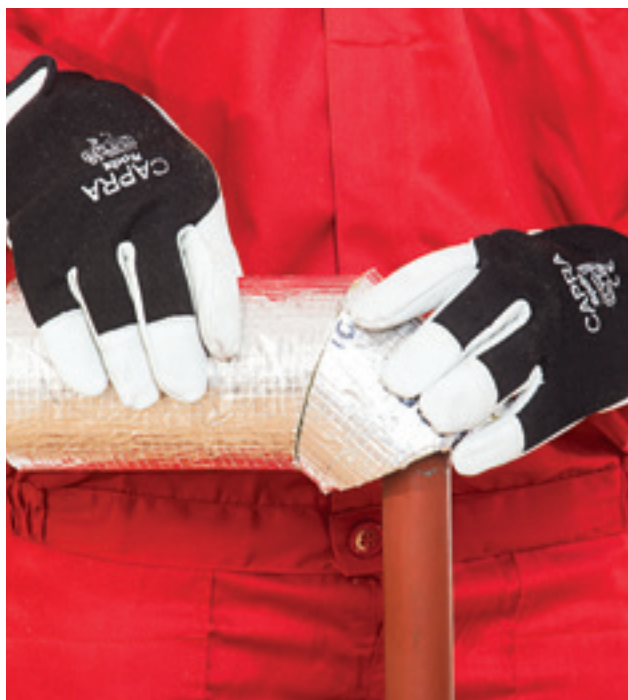
4. Tikslus alkūnės dalies sujungimas su tiesiąja kevalo dalimi