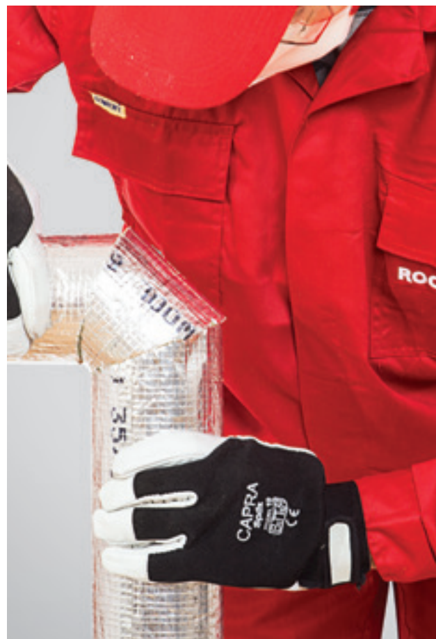
6. Visų dalių tikslus sujungimas