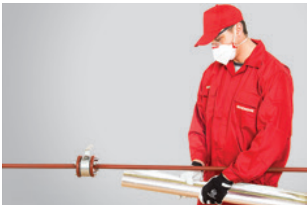
1. Kevalas dedamas ant tiesaus vamzdžio