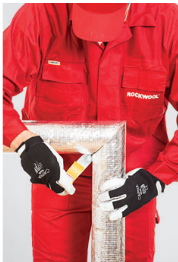
6. Skersinių kevalų sujungimo (sandūros) klėjimas lipnia aliuminio juosta