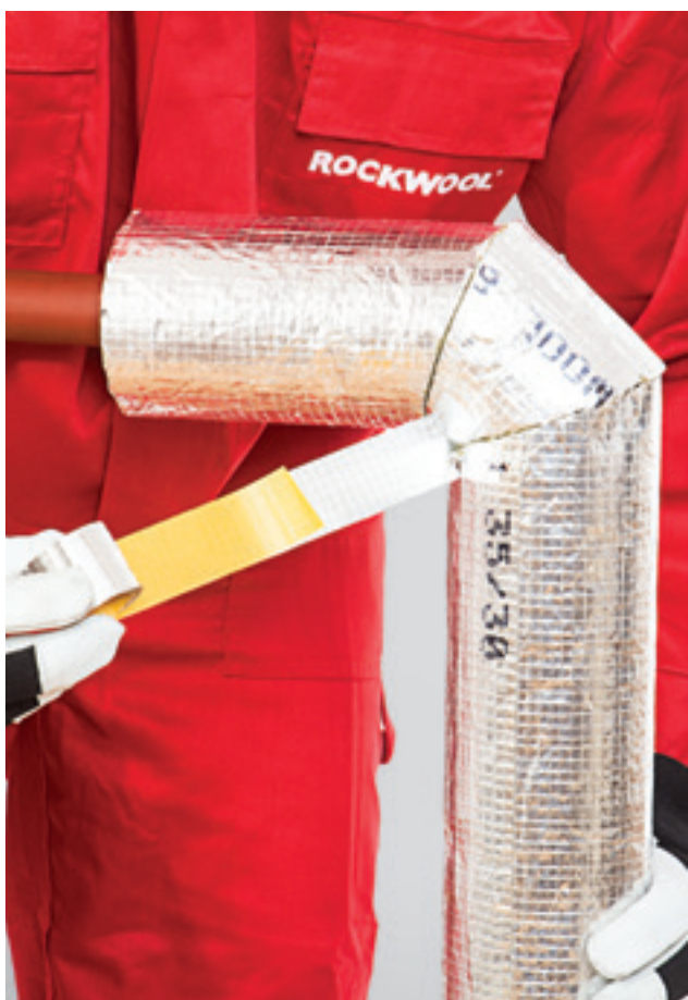
7. Skersinių sujungimų klijavimas lipnia aliuminio juosta