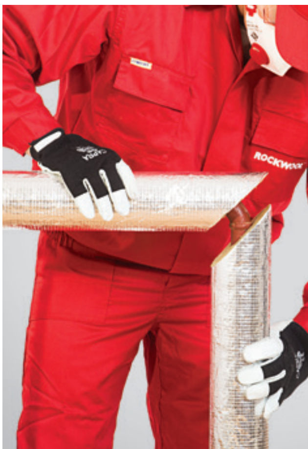
5. Alkūnės izoliacijos abiejų dalių sujungimas