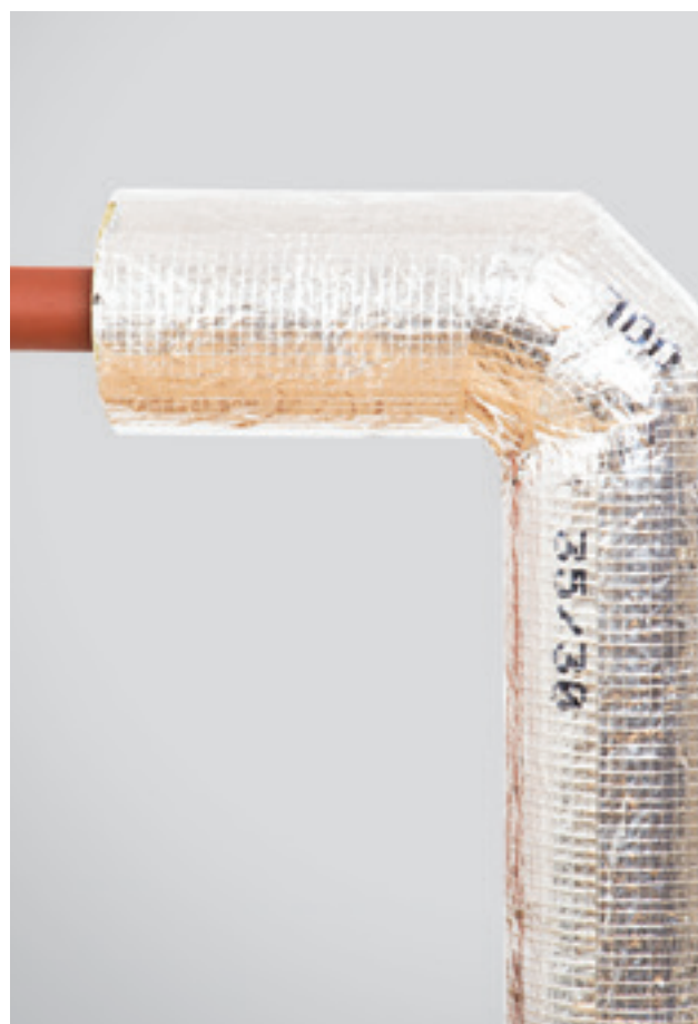
8. ROCKWOOL 800 kevalu izoliuota vamzdžio alkūnė su viena alkūnės dalimi