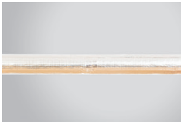
8. Paruošta izoliacija iš dviejų ROCKWOOL 800 kevalų